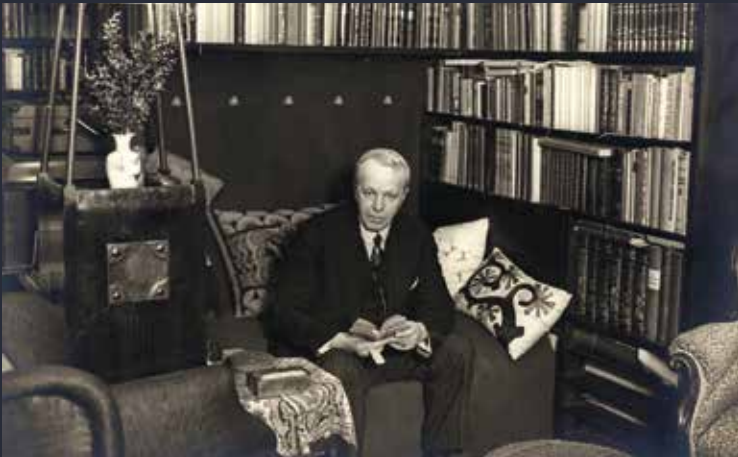
1925 Erkki Melartin 50-vuotiaana työhuoneessaan Helsingin musiikkiopistolla