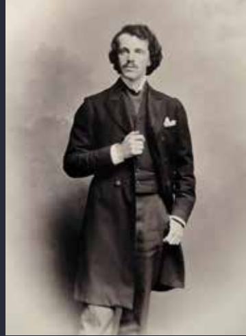
1900 Melartin Wienissä Mathausin kuvaamossa