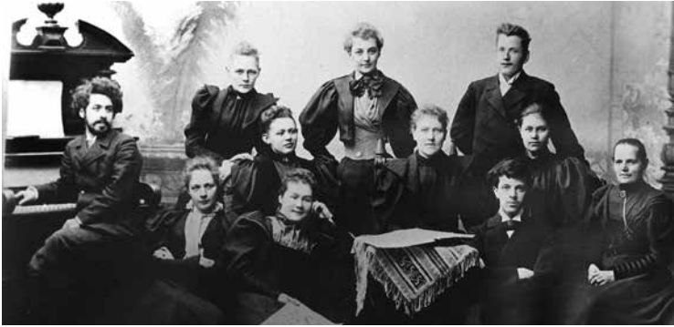
1893 Melartin musiikkiopistolaisten yhteiskuvassa